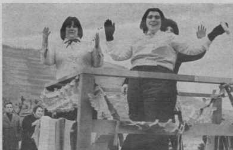
„Fidelle alte Möhnen“ im Rosenmontagszug 1965