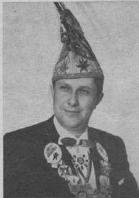
Rudolf Weltken Se. Exzellenz Minister vom Hohen Rat