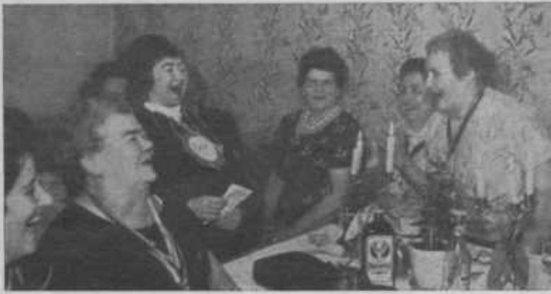
Südernacher Frauen „Immer lustig“ garantieren stets für Stimmung und Laune.