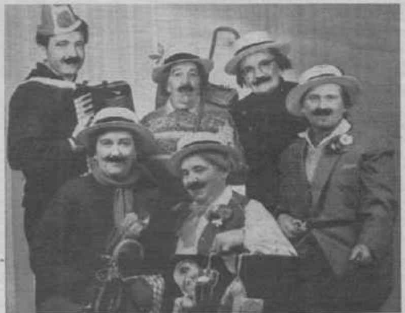
„Ewig Junge Möhnen“ nach der Musterung

„Ewig Jung“, stets in Schwung! Das beweist die Musterung der Möhnen zur Bundeswehr am Schwerdonnerstag 1965 (siehe Foto).