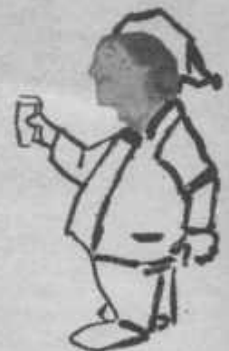
Puddel Köbi im Jahr 2000

Waldi: Dann mach du dein Forell e Stöck kläner, dann mache esch bei meinem Kronleuchte et Licht aus!